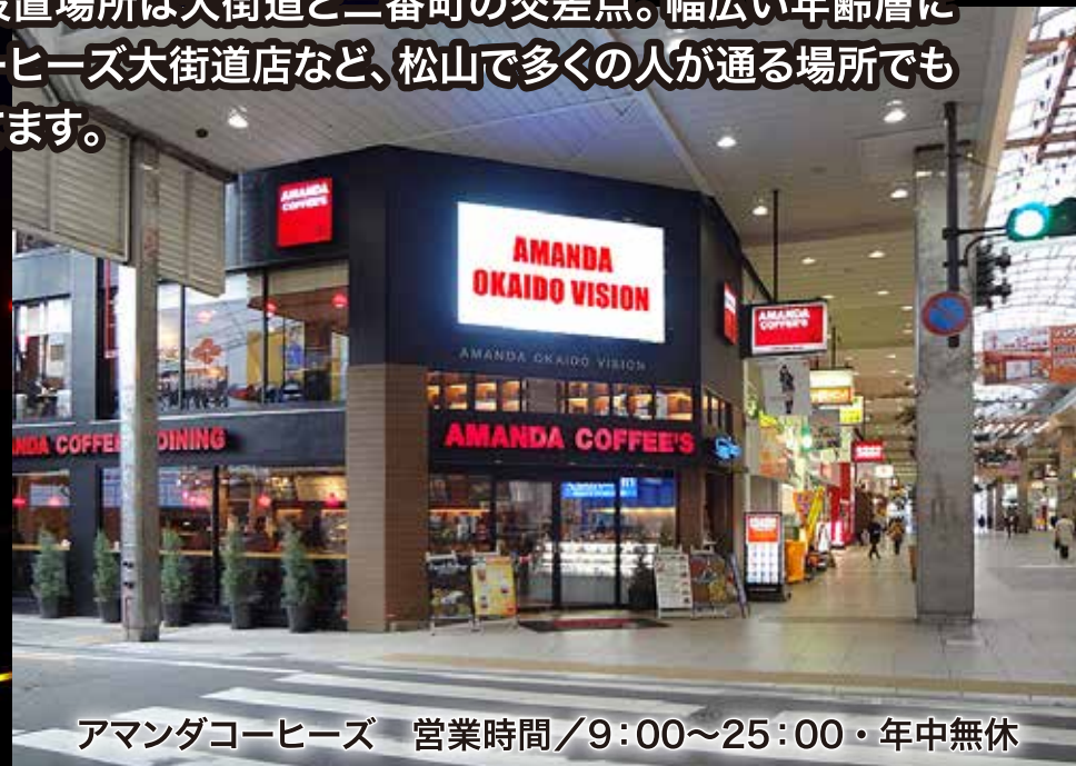
アマダコーヒーズ 営業時間/9:00~25:00・年中無休